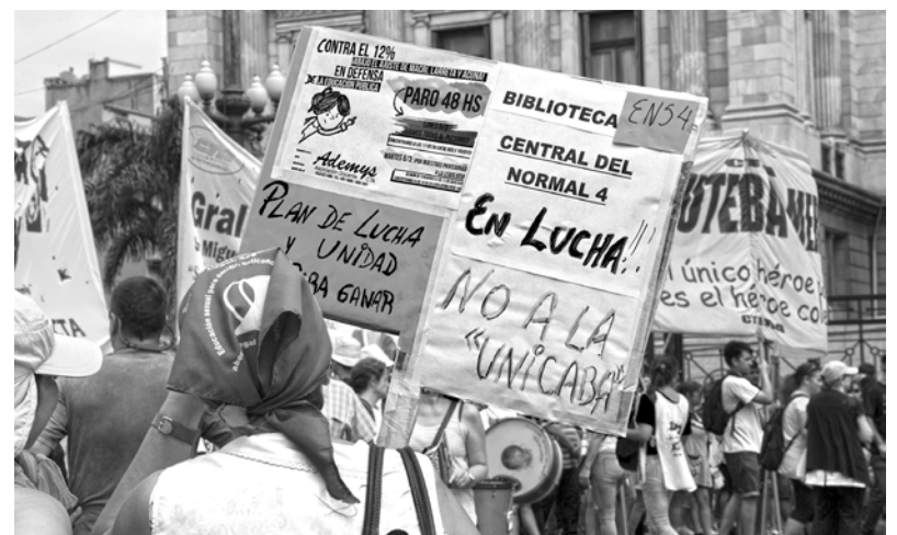
Macri cierra escuelas y despide docentes

En 2018 el gobierno decidió liquidar la rama adultos y las escuelas especiales, dejando a miles de jóvenes en la calle y centenares