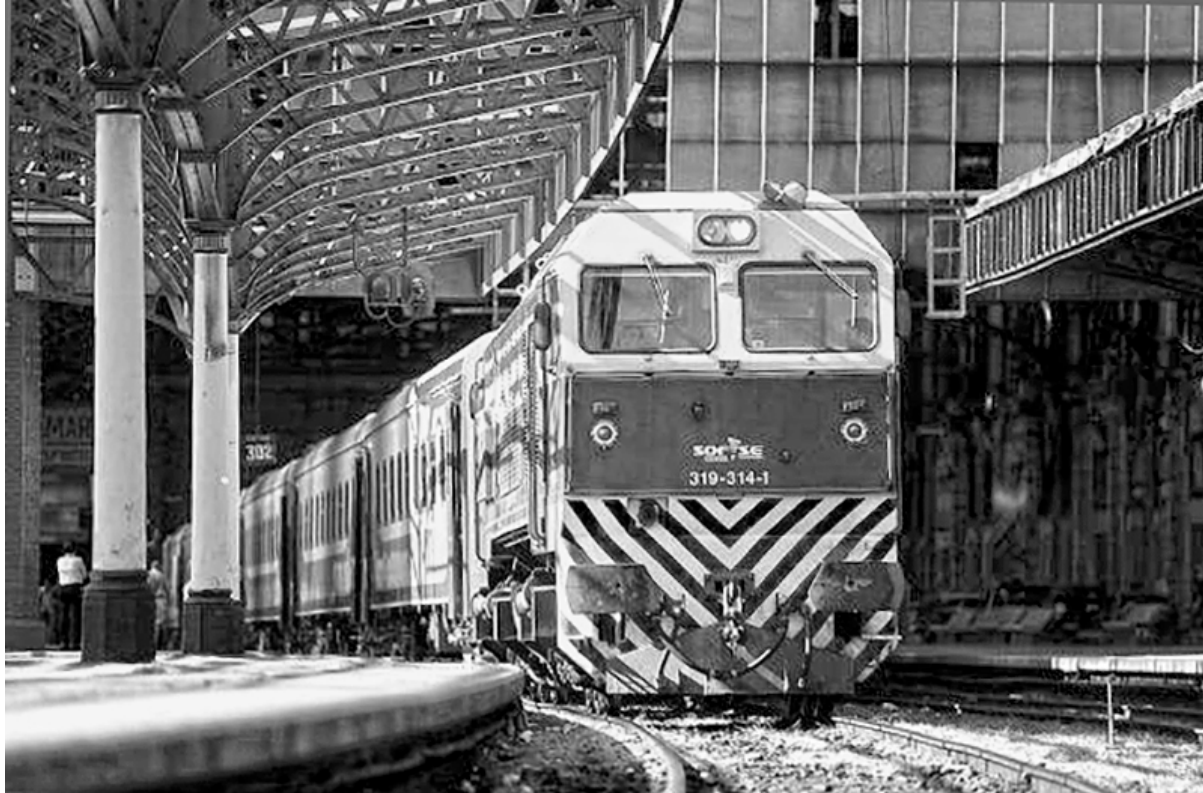
Los ferrocarriles son una herramienta fundamental para el desarrollo del país

Los ferrocarriles surgieron en 1854 por iniciativa de la provincia de Buenos Aires, cuando otorgó la concesión a un grupo de ciudadanos porteños para construir una línea ferroviaria desde la ciudad de Buenos Aires hacia el oeste. Con el tiempo, se constituyeron en una herramienta clave para unir las enormes distancias del territorio nacional, llegando a las regiones más despobladas del Noroeste, Cuyo, el Chaco y la Patagonia con un servicio eficiente, confortable y con tarifas accesibles.