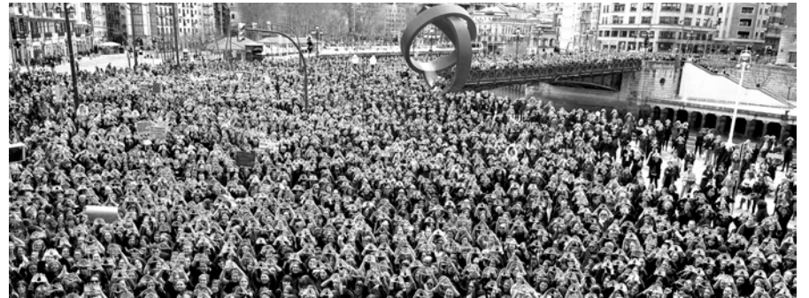
En Bilbao gritaron masivamente "no a la brecha salarial"