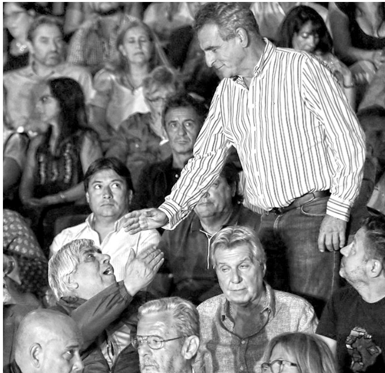
Hugo Moyano y Agustín Rossi se vienen reuniendo para reciclar al peronismo

La "mesa de unidad" que promueve Rossi con el resto del peronismo no es salida ante el ajuste de Macri. Cristina pidió el voto para "frenar el ajuste" pero sus diputados no aparecen en ninguna lucha. Ante la rebelión del 8M que reclama el aborto legal la ex presidenta mantiene un silencio cómplice, igual que la mitad de los diputados del Frente para la Victoria que están en contra de ese derecho fundamental que reclaman las mujeres. ¿Es alternativa el kirchnerismo ante las mujeres que luchan? Claro que no.