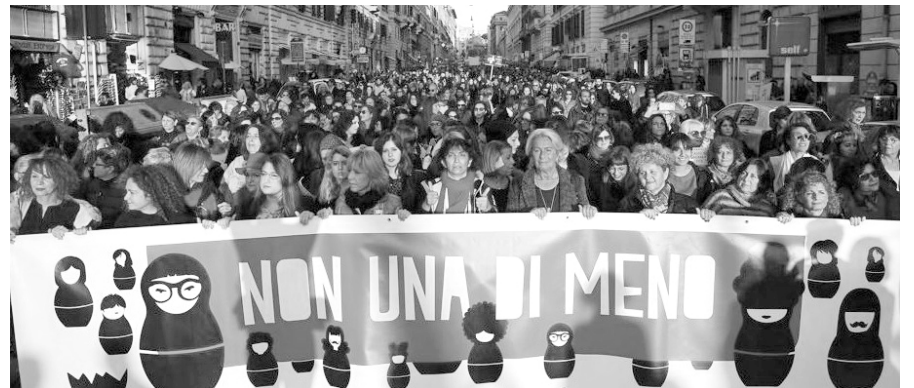
Las mujeres en Roma también piden "ni una menos"

mujeres retoma la experiencia de las islandesas que en 1975 paralizaron el país para reclamar por la igualdad.