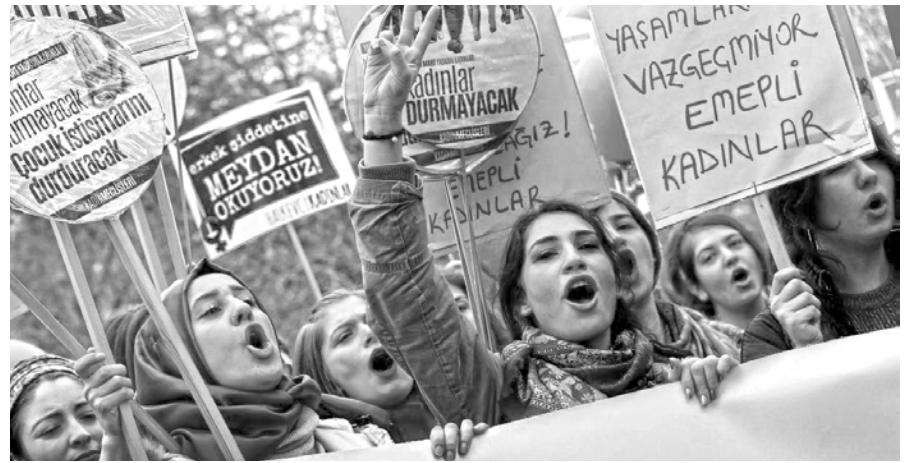
En Estambul reclamando que "el lugar de las mujeres es la resistencia"

Desde el #NiUnaMenos en la Argentina en 2015 se desarrolló un efecto expansivo, generando una nueva ola en las luchas del movimiento de mujeres. La pelea contra la violencia machista despertó la lucha contra el patriarcado, pero también contra las diversas formas de opresión y explotación capitalista. Por ello, el primer paro internacional de mujeres fue acompañado por un progresivo llamamiento de reconocidas feministas norteamericanas para desarrollar un "feminismo del 99 por ciento", es decir, de todas las mujeres no explotadoras, que impactó en amplios sectores. Asimismo, la propuesta de paro de