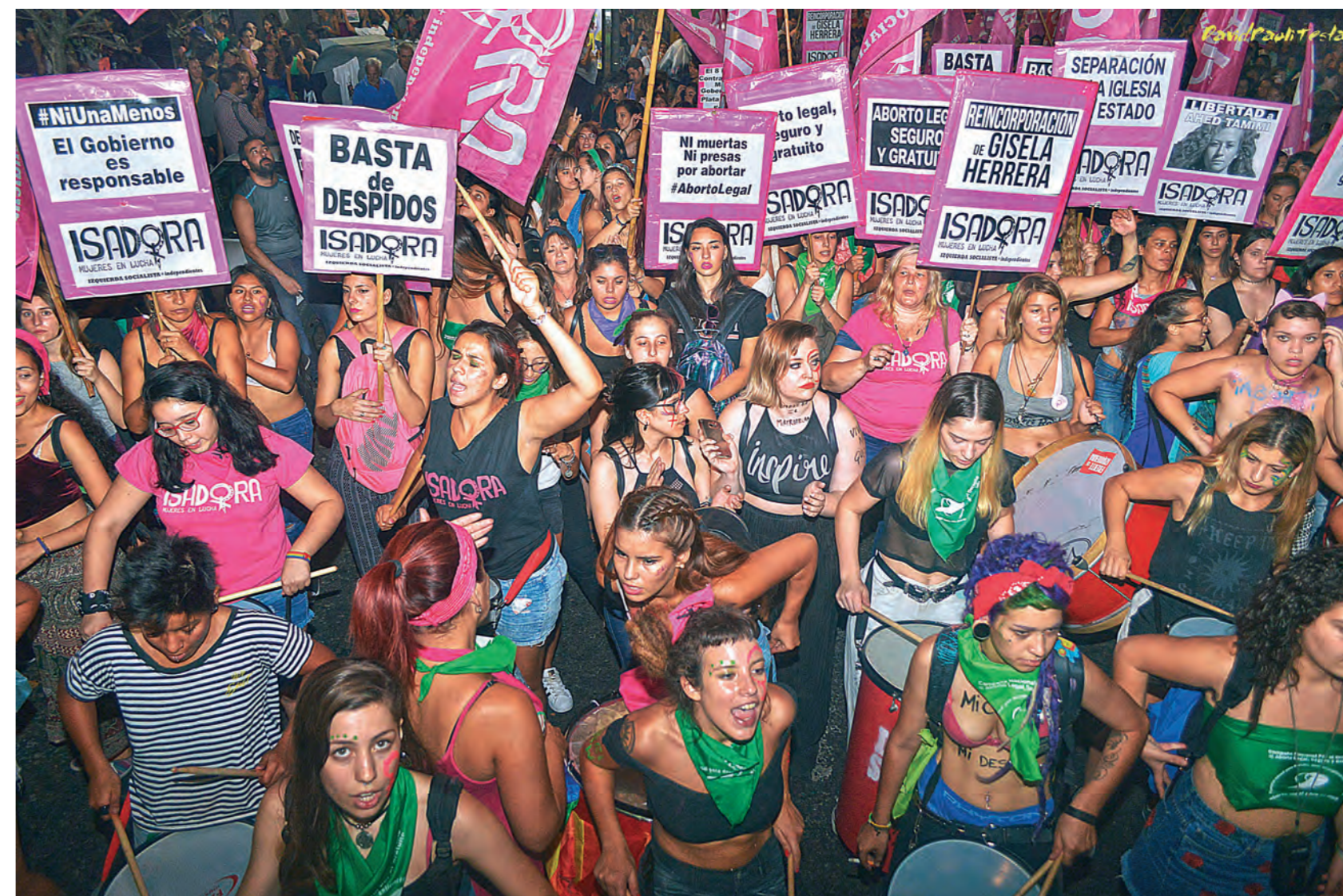
Fue impactante la columna de Isadora (Izquierda Socialista + independientes) en la marcha del 8M en Buenos Aires

Desde Isadora estamos convencidas de que solo con la lucha lograremos conquistar nuestros derechos. La historia demuestra que ningún gobierno nos regaló nada. Todo lo que conseguimos fue porque se lo arrancamos. Por eso insistimos en que la marcha del 8M fue un duro golpe para el gobierno y las mujeres salimos fortalecidas para seguir dando esta pelea. Ahora tenemos el desafío de imponer el aborto legal, seguro y gratuito en nuestro país, tal como lo plantea el proyecto de ley de la Campaña Nacional por el Derecho al Aborto. Invitamos a todas las compañeras que marcharon con nosotras a sumarse a Isadora para dar con más fuerza esta pelea.